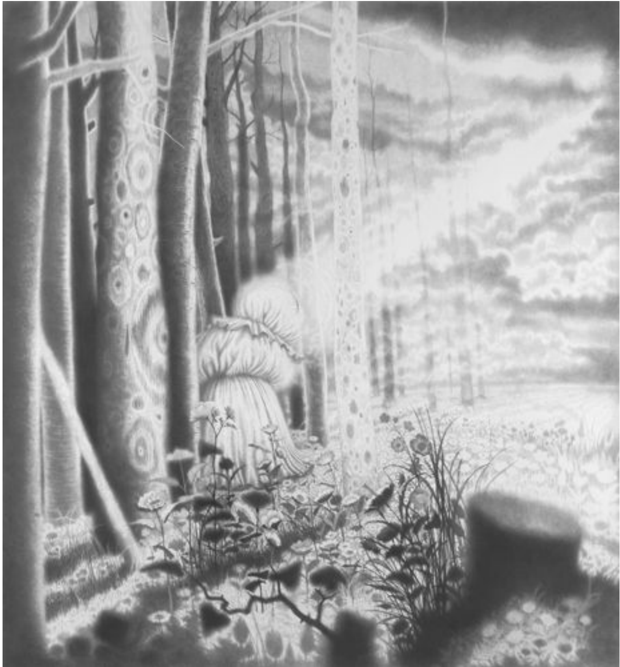
La rencontre , 2011-2013, mine de plomb sur papier, 210 x 200 cm